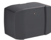
› Not-Akku (nur BS60)