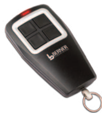
› Funkempfänger und Handsender